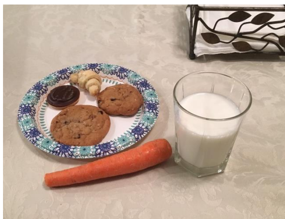
(d) サンタさんのためのお供え物