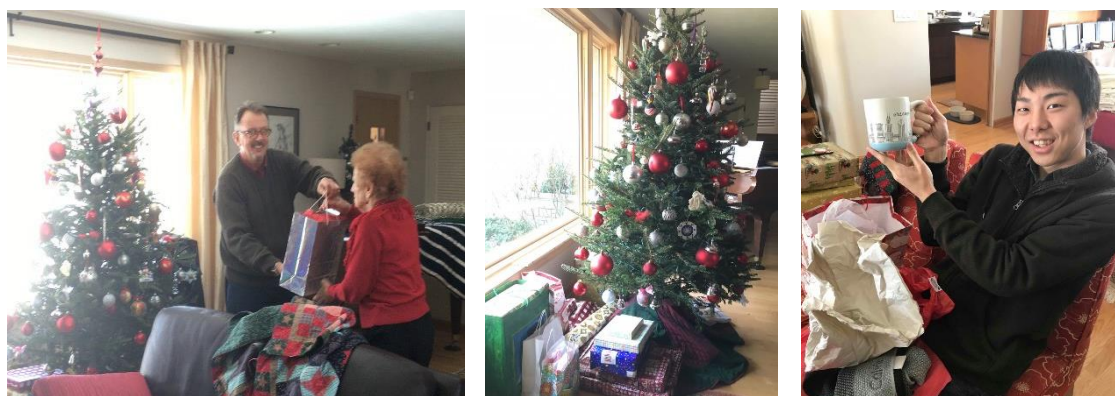
図 3. 25 日のクリスマス

これらの出来事は私にとって、とても貴重な経験だったと思いますし、友人とその家族の方、そして家族の友人の方たちにはとても感謝しています。