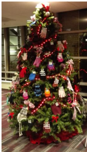
写真1 クリスマスツリー

12月に入り様々な場所でクリスマスの飾り付けを見ることができるようになりました。学内でも多くの場所に写真1のようなクリスマスツリーがあり、私の住んでいるアパートメントの廊下には写真2に示す飾り付けがされ、アメリカではクリスマスがとても大きなイベントであることが分かります。