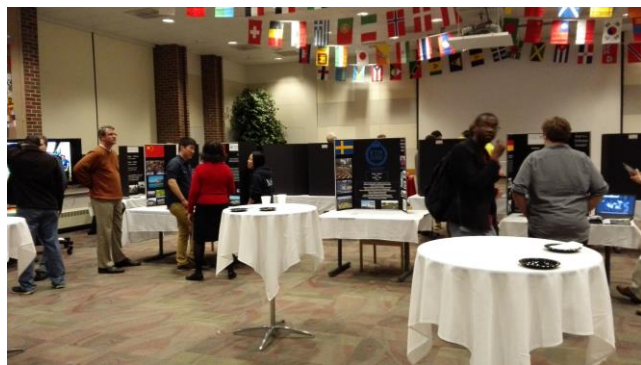
写真4 留学説明会の様子

12月上旬にRHITの学生のための留学説明会がありました。写真4にその様子を示します。私は写真5に示すKITのブースに立って、KITや日本についての質問に答えました。数人の学生が熱心に質問をしにきたり、来年のプログラムに参加すると言っていた学生もいたので、来年金沢で会えることを楽しみにしています。また、様々な国の軽食を食べながら他の学生と交流することもでき有意義な時間を過ごすことができたと思います。