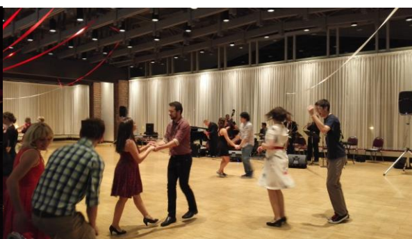
写真7 スウィングダンスイベントの様子