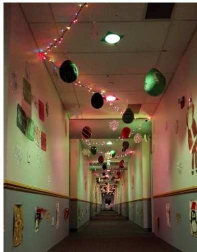
写真2 廊下の飾り付け